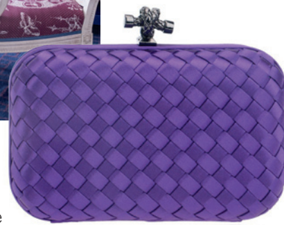
Za trendseterke, ženska tašnica.