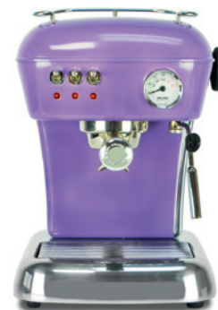
Espresso aparat takođe ima šifru Ultra Violet 18-3838.

SREĆNA VAM ULTRALJUBIČASTA 2018. GODINA, GODINA INVENTIVNOSTI I IMAGINACIJE!