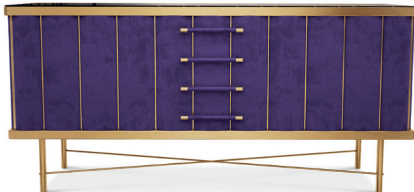
Komoda "Columbus", BYSWANS.