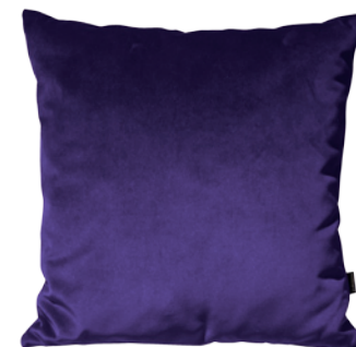
Jastuci po željenim dimenzijama. Veliki izbor prirodnih materijala, od svile do vune. Prodaje ENVIRO.