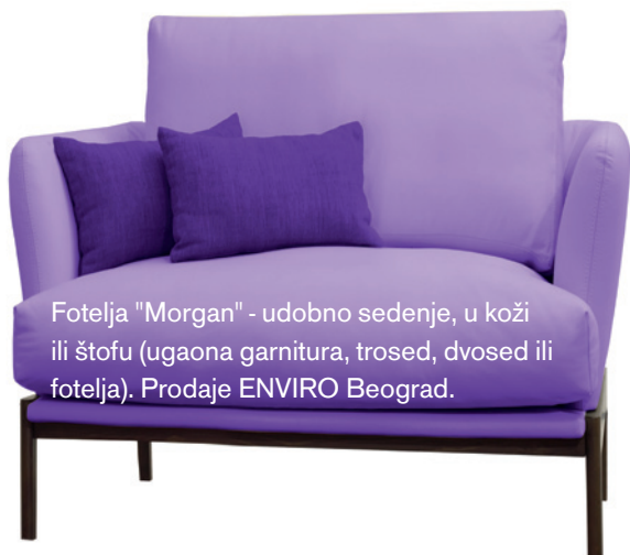
Fotelja "Morgan" - udobno sedenje, u koži ili štofu (ugaona garnitura, trosed, dvosed ili fotelja). Prodaje ENVIRO Beograd.

Enigmatična ultraljubičasta takođe je dugo bila simbol kontrakulture, nekonvencionalnosti i umetnosti . Muzičke ikone Prins, Dejvid Bouvi i Džimi Hendriks uveli su nijanse ultraljubičaste, kao izraze individualnosti, u vrhove zapadne pop kulture. Nijansirana i puna emocija , njena